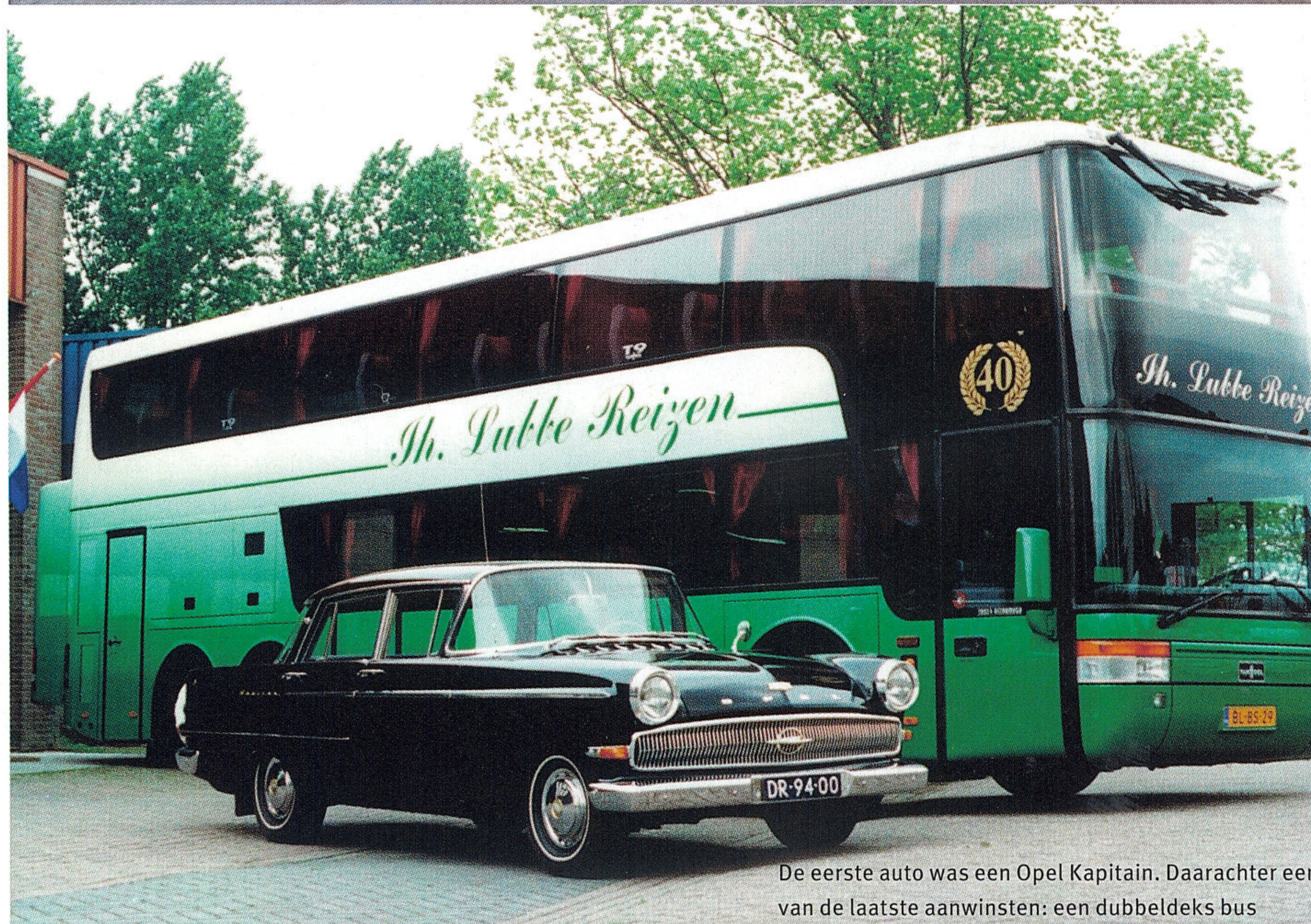
De eerste auto was een Opel Kapitain. Daarachter een van de laatste aanwinsten: een dubbeldeks bus

Het wagenpark van Th. Lubbe Reizen bestaat uit 95 (rolstoel)busjes, 16 luxe touringcars en 2 Mercedes personenwagens.