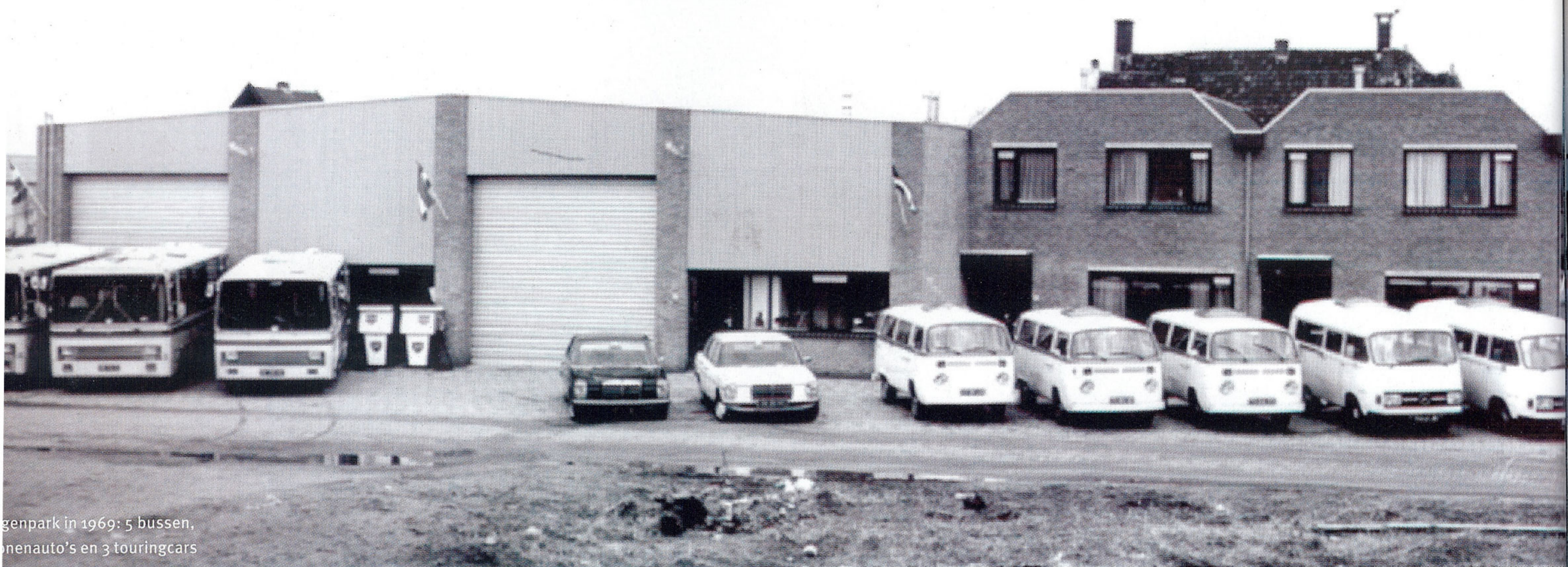
Wagenpark in 1969: 5 bussen, 2 personenauto's en 3 touringcars