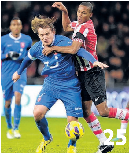
PSV pakt Twente in