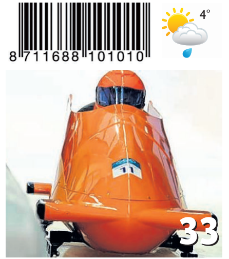
Zelfreflectie met een rotgang